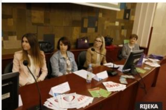
U povodu Europskog dana darivanja organa u Gradskoj vijećnici održana je javna tribina "Volim grad koji donira", na kojoj je predstavljen istoimeni projekt Međunarodne udruga hrvatskih studenata medicine ...